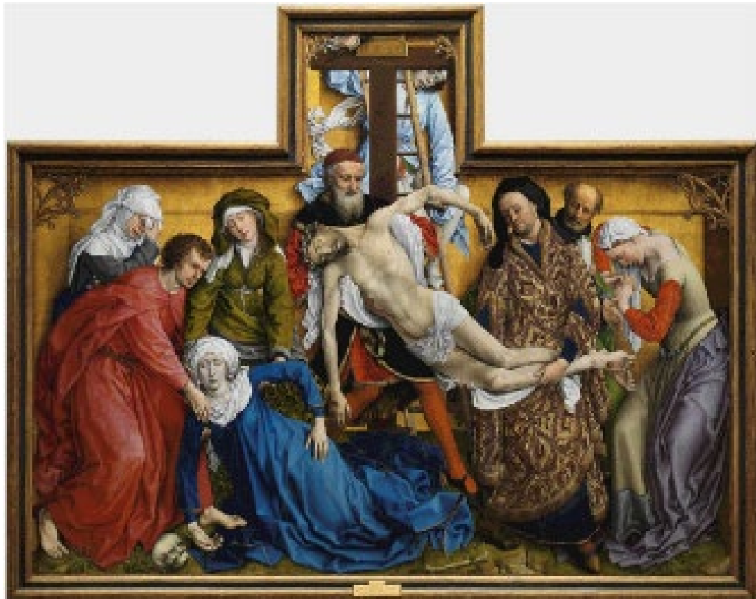
1. El Descendimiento