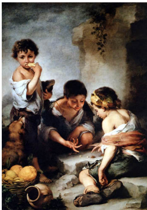
Niños mendigos jugando a los dados. B. E. Murillo

* A partir de sus conocimientos y del material adjunto desarrolle el tema: El siglo XVII (Los Austrias del siglo XVII / Gobierno de validos y conflictos internos / El ocaso del Imperio español en Europa / Evolución económica y social. La cultura del Siglo de Oro). Valoración máxima: 6 puntos.